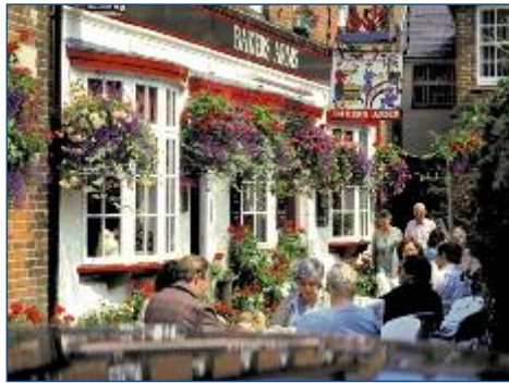
Traditioneller Pub in Winchester