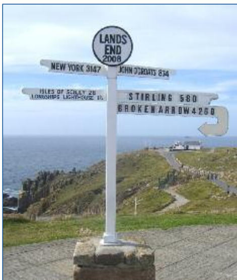
Land's End, die Südwestspitze Cornwalls