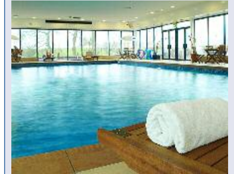
Der Pool des Holiday Inn