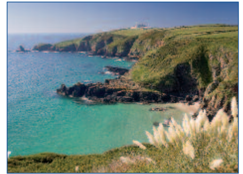
Die traumhafte Küste Cornwalls

05.05. BIS 12.05.2012 • FLUG AB/AN HANNOVER • AB € 1.299,- P.P. IM DZ