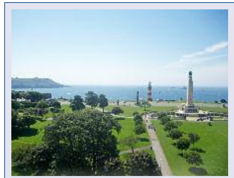
Herrlicher Ausblick vom Hotel