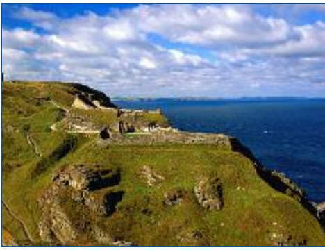
Die Burgruine von Tintagel