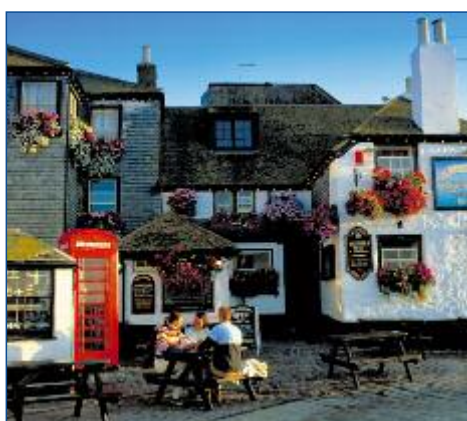
"Sloop Inn", einer der ältesten Pubs Cornwalls

Stand: Okt. 2011, Änderungen vorbehalten.