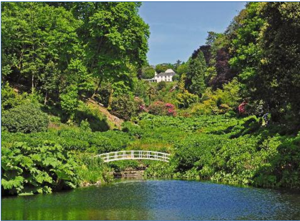
Trebah Garden gehört zu den 80 herrlichsten Gärten der Welt

D iese unvergessliche Rundreise bringt Ihnen die Höhepunkte Südens Englands näher. Ausgehend von London, der pulsierenden und an Sehenswürdigkeiten so reichen Metropole, geht es durch romantische Grafschaften und reizende Landstriche, Sie genießen das wunderbare Flair von Badeorten wie Bath und wandeln auf den Pfaden der traditionsreichen englischen Geschichte. Ein einmaliges Landschaftspanorama bietet Cornwall. Die langen Sandstrände, steile Klippen, Fischerdörfer, Heideflächen sowie ehrwürdige Burgen und Schlösser aus der Zeit von König Arthus - Süds England ist eine wahre Schönheit. Und Sie brauchen sie nur noch zu entdecken.