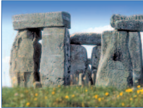
Die mystischen Steininformationen von Stonehenge