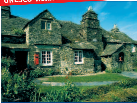
Uriges „Old Post Office“ in Tintagel

UNESCO-Weltkulturerbe: das architektonische Juwel Bath