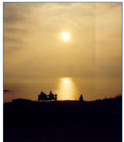
Sonnenuntergang über der Küste Cornwalls